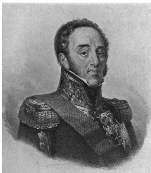
Louis Gabriel Suchet

B iografia generała, późniejszego marszałka Louisa Sucheta była na swój sposób typową w mozaice wysokich dowódców cesarskich czasów napoleońskich. Urodził się 2 marca 1770 roku w Lyonie. Był synem zamożnego właściciela fabryki wyrobów jedwabnych. Jednak młody Louis nie poszedł „fabrycznymi śladami” swego ojca. Został bowiem wciągnięty w wir wydarzeń nowych burzliwych i groźnych, wydarzeń, jakie niosła rewolucja francuska ogarniająca kraj cały, „zmiatająca z posad” monarchiczne, feudalne wiekowe prawidła, tworząca rzeczywistość republikańską, nieznaną, która to głoścąc piękne, wzniosłe hasła „wolność, równość, braterstwo”, równocześnie niosła ze sobą morze cierpień i krwi, bezmiar przemocy, bezwzględnych, bezmyślnych decyzji, zachowań... I były też nieustanne wojny, które spadły na rewolucyjną Francję prowadzone przez potężnych europejskich monarchów w imię zachowania tego, co jedynie słuszne, przez stulecia przetrwałe, uświęcone... feudalne. W takich oto rewolucyjnych okolicznościach młody Louis podjął decyzję o wstąpieniu do wojska, do kawalerii gwardii narodo-